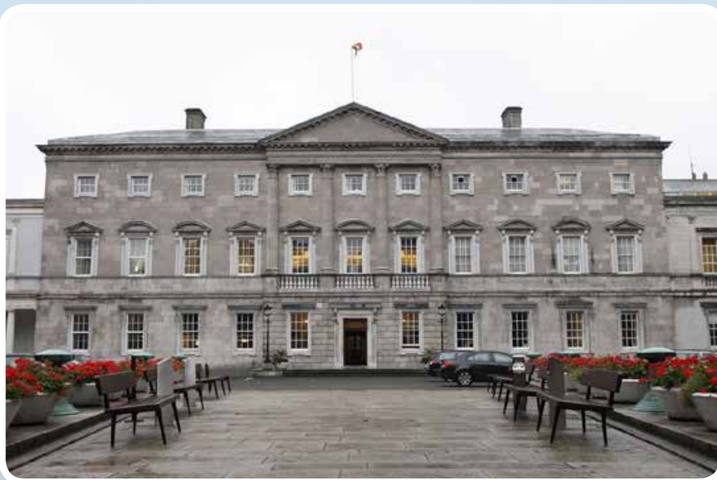
Irish Parliament (Dáil Éireann)

Nachmittags Weiterfahrt zum Flughafen und Rückflug nach Düsseldorf.