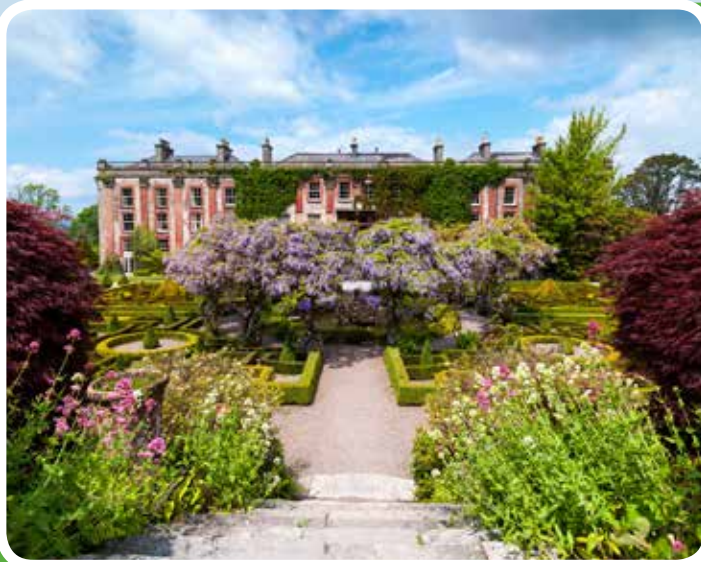
Bantry House and Garden

mBláth, wo er bei einem Attentat erschossen wurde, liegt nicht weit entfernt. In Clonakilty selber aber gibt es noch mehr an Interessantem, u.a. die derzeit jüngste Whiskeybrennerei Irlands, die wir natürlich „heimsuchen“ wollen. Und als Cromwell'sche Soldaten sich die Timoleague Abbey, ein ehemaliges Franziskanerkloster, genauer anschauten, fanden sie: große Vorräte spanischen Weins!