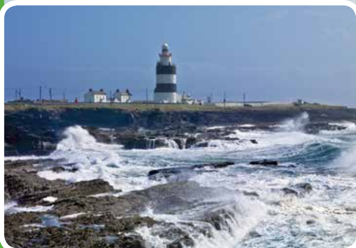
Hook Head Lighthouse

Der „Irish National Heritage Park“ bei Wexford erlaubt einen Gang durch ca. 9.000 Jahre irische Geschichte - für erstmalig Mitreisende ein interessanter Einstieg, für „Wiederholende“ willkommene Auffrischung in irischer Historie. Auf unserer Fahrt in Richtung Hook Head steht heute auch Tintern Abbey auf dem Programm, die eindrucksvollen Reste eines der irischen Zisterzienser-