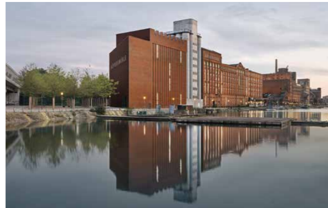
Museum Küppersmühle

Sa 03.06.23, 11.00–18.00 Uhr, 44,- € Treffpunkt: Hauptbahnhof Hagen