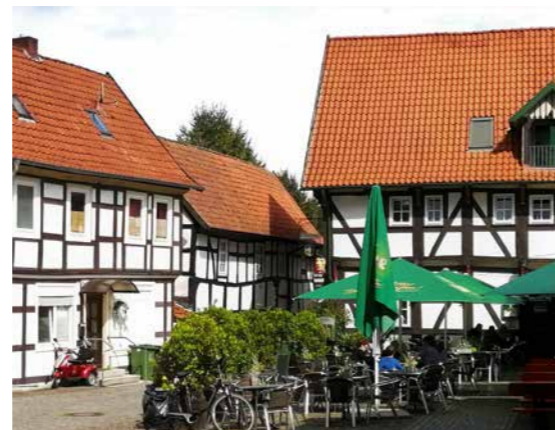
Bad Essen